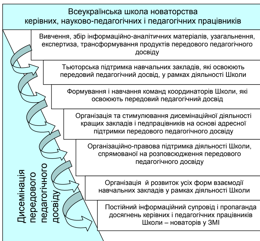
Рис. 1. Основні форми дисемінації передового педагогічного досвіду в рамках діяльності Всеукраїнської школи новаторства керівних, науково-педагогічних і педагогічних працівників

Технологічний цикл роботи з передовим та інноваційним педагогічним досвідом вважається завершеним лише у тому випадку, якщо реалізується модель освоєння цього досвіду професійно-педагогічним співтовариством. Саме в системі роботи Школи новаторства реалізовуватимуться основні форми дисемінації передового педагогічного досвіду в рамках Консорціуму закладів післядипломної освіти (рис. 1).