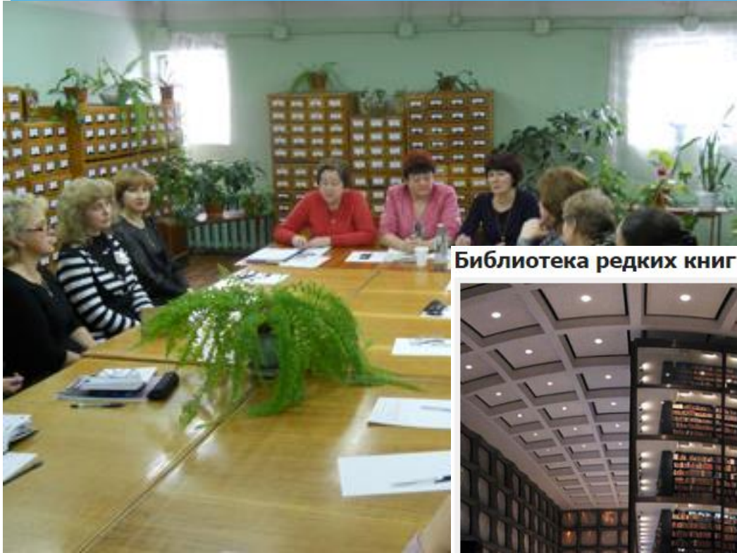
Бібліотека рідких книг Йельського університету в Нью-Хейвене, США