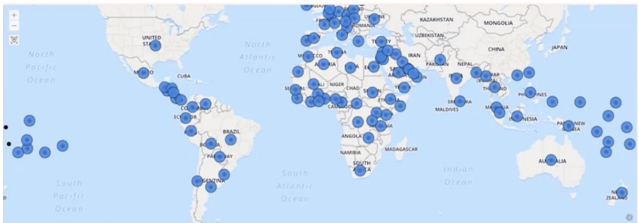
Рис. 1. Карта партнерів Facebook, які займаються фактчекінгом для цього ресурсу

Всього за шість років кількість фактчекінгових редакцій у світі зростає майже в сім разів — 44 у 2014 році та 290 у 2020-му. Дедалі більше журналістів, редакцій та країн тепер займаються фактчекінгом. На рис. 1 зображена карта партнерів Facebook, які займаються фактчекінгом для цього ресурсу.