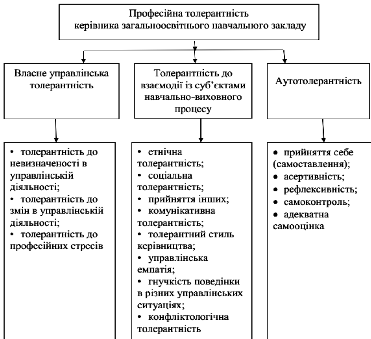
Рис. 1. Структурна модель професійної толерантності керівників освітніх організацій (на прикладі керівників загальноосвітніх навчальних закладів)

будь-якій комунікації. До складових толерантності до взаємодії із суб'єктами навчально-виховного процесу віднесено: етнічну й соціальну толерантність, прийняття інших, комунікативну толерантність, толерантний стиль керівництва, управлінську емпатію, гнучкість поведінки в різних управлінських ситуаціях, конфліктологічну толерантність тощо.