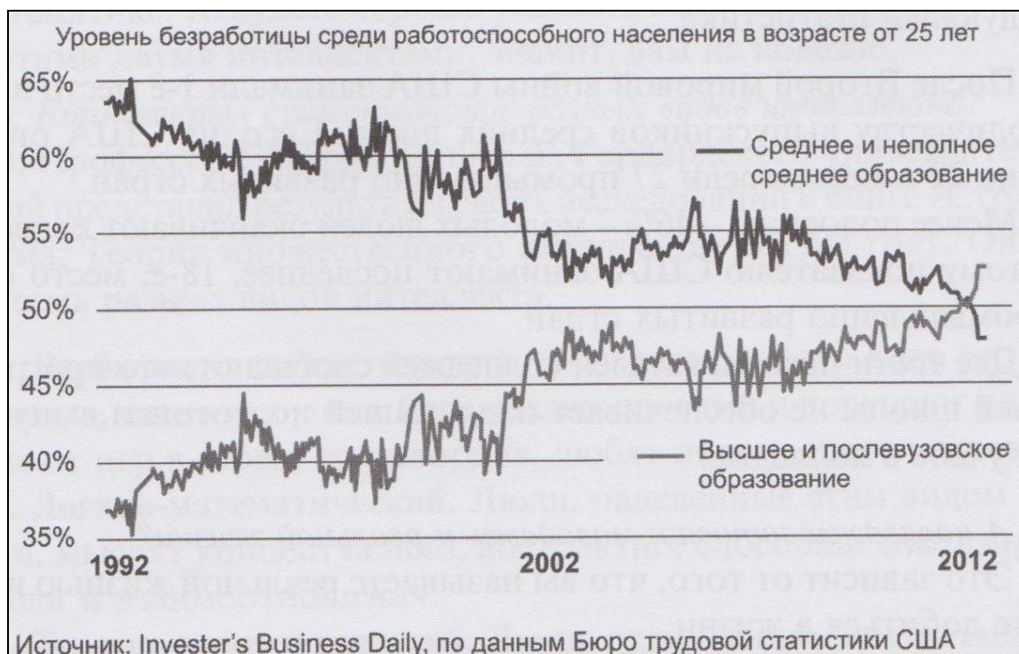
Рис. 1. Динаміка безробіття в США, відповідно до освітнього рівня.

Перш за все, засновник компанії Rich Dad Роберт Кійосакі звертає увагу на переміщені акцентів з площини працевлаштування дорослої людини за фахом у площину підвищення своєї фінансової грамотності і цінності як фахівця.