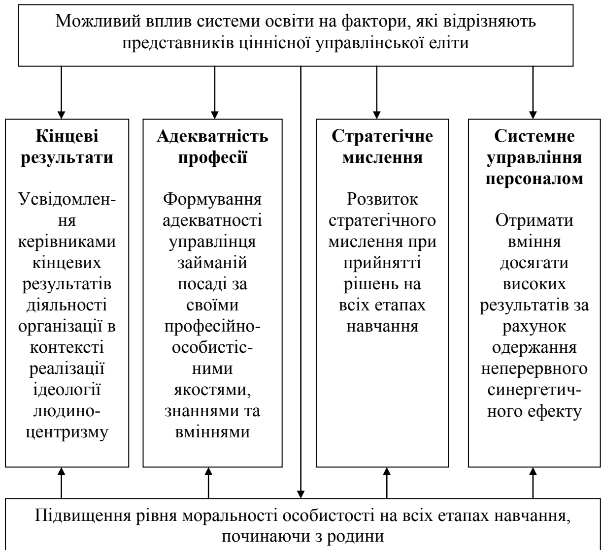
Рис. 2. Стратегічні напрями формування ціннісної управлінської еліти в системі освіти

Приклад. Моральність повинна бути обов'язковою рисою представників всіх видів управлінської еліти. Але оскільки масштаби впливу на оточуючих найбільші у політичній еліті, тому саме цій категорії управлінців треба в першу чергу усвідомити цю особливість.