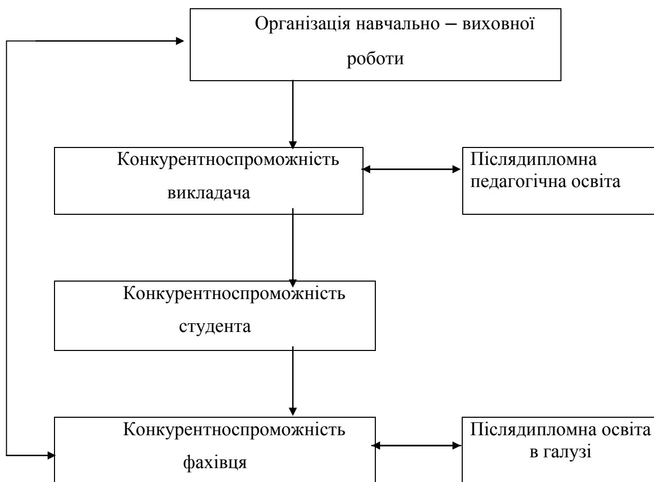
Рис.2 Фактори забезпечення конкурентноспроможності фахівця

У системі вищої освіти якість підготовки фахівців оцінюється насамперед якістю навчально – виховного процесу. Головне його завдання – підготовка