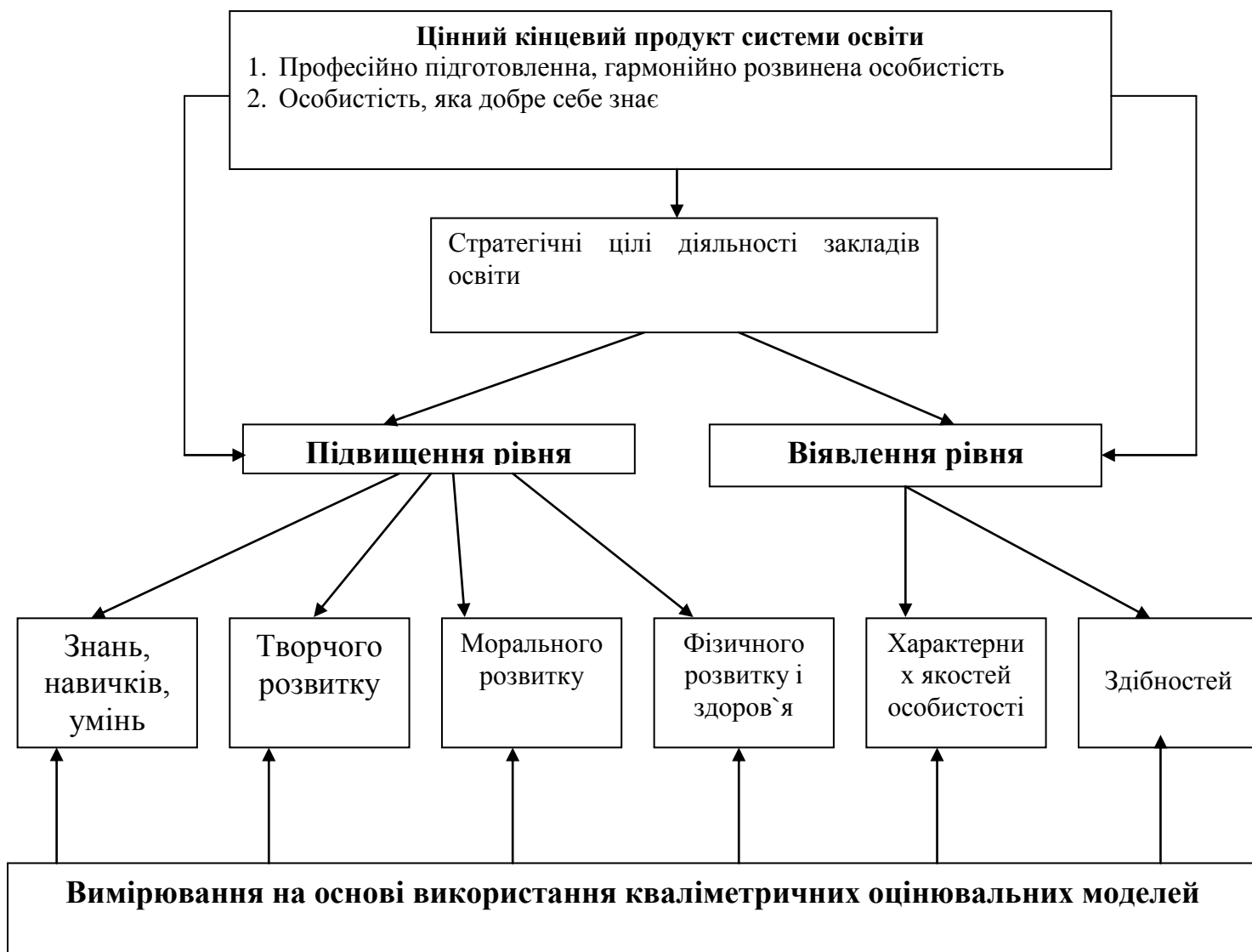
Рис. 3. Стратегічні цілі системи освіти виходячи з цінного кінцевого продукту діяльності закладів освіти

У цьому випадку цінним кінцевим продуктом системи освіти є професійно підготовлена гармонійно розвинена особистість, що добре знає себе.