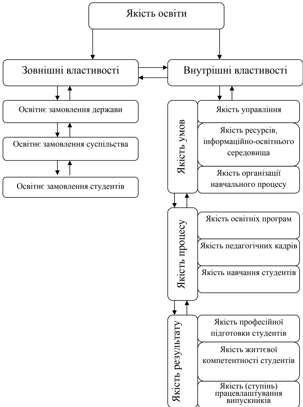
Рис. 3 Зовнішні і внутрішні властивості якості освіти у вищому навчальному закладі.

Умови сьогодення вимагають від вищих навчальних закладів переходу від традиційного способу внутрішнього контролю до цілісної системи