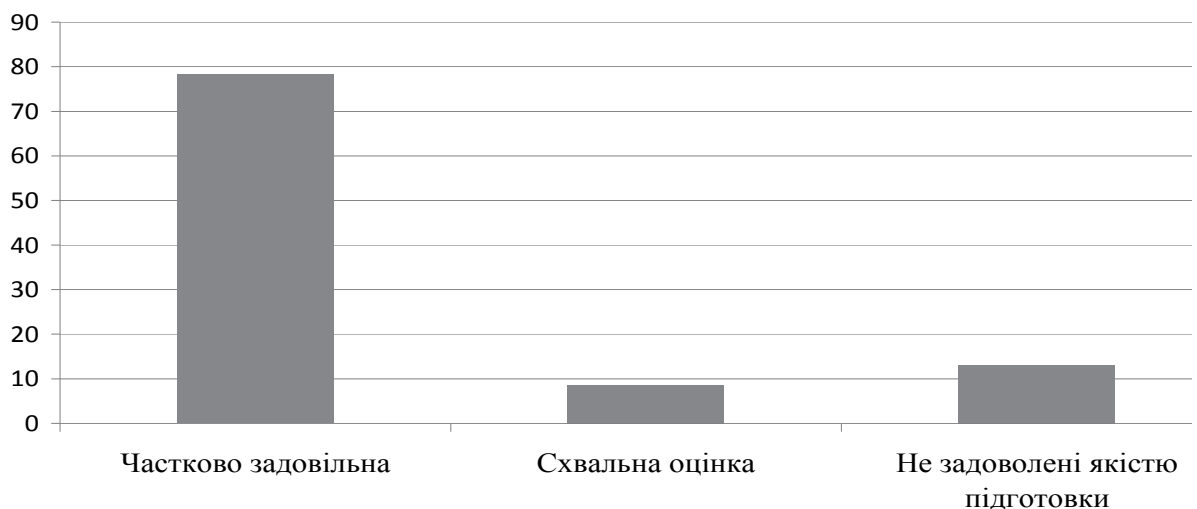
Рис. 1. Оцінювання якості професійної підготовки майбутнього фахівця за результатами опитування роботодавців

За результатами проведеного нами анкетування роботодавців (30 підприємств – 22 (73%) є приватними, 20 (68%) працюють більше 10 років на ринку; на 9-ти (30%) кількість працівників сягає 500 осіб і більше) встановлено, що якість професійної підготовки майбутніх фахівців більшість респондентів оцінили як «частково задовільну» 12 осіб (78,3%). 3 особи (8,6%) роботодавців дали схвальну оцінку якості підготовки фахівців та не задоволені якістю підготовки 4 особи (13,1%) (рис. 1) [11].