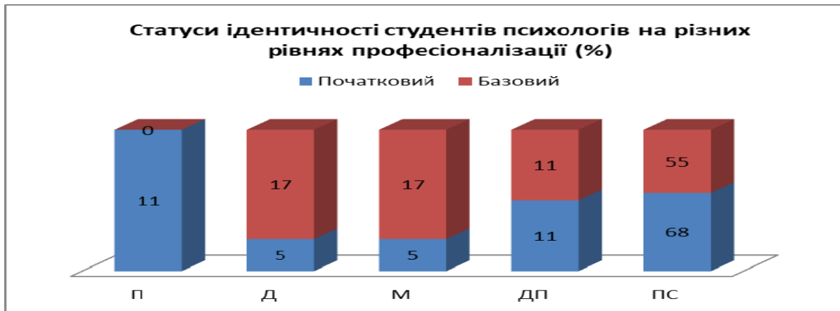
Рис. 3 Статуси ідентичності студентів-психологів на різних рівнях професіоналізації

Отже, аналіз отриманих даних показує, що найбільше респондентів у двох групах представляють псевдопозитивну ідентичність (відповідно 68% на початковому та 55% на базовому рівні професіоналізації). Це, в свою чергу, свідчить на користь характеристик стабільного заперечення своєї унікальності або, навпроти, її амбітні акценти з переходом в стереотипію, а також порушення механізмів ідентифікації й відокремлення в сторону гіпертрофованості порушення тимчасової зв'язності життя, ригідність Я-концепції, хворобливе неприйняття критики на свою адресу, низьку рефлексію. У деяких випадках псевдоідентичність можна трактувати як гіперідентичності наслідком тотального поглинання статусом, роллю, роботою, іншим об'єктом або суб'єктом, при високо позитивному оцінюванні власних якостей і порушення довірчих, гнучких зав'язків з соціумом, прагненні досягти мети будь-якими засобами [20].