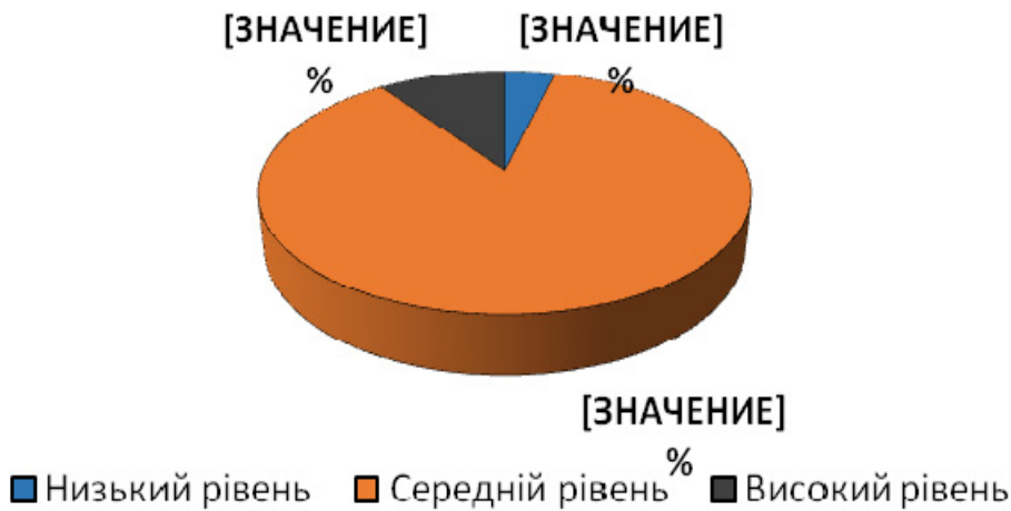
Рис 2 Розподіл стану «відчуженість» у підлітків

З даних діаграм (рис. 1, рис. 2) спостерігаємо, що серед підлітків екзистенційно-конфліктні стани «самотність» і «відчуженість» з високим рівнем вираженості зустрічаються досить рідко – не перевищує 11%. При цьому, стан відчуженості спостерігається дещо частіше, ніж стан самотності. Цей факт заслуговує на пильну увагу з боку фахівців, оскільки рефлексія переживання відчуженості для підлітків є у край важкою, а невирішені екзистенційні конфлікти можуть істотно деформувати надалі життєвий шлях особистості. Дані розподілу, які отримані для екзистенційного стану «самотрансцендентність» представлені на діаграмі (рис. 3).