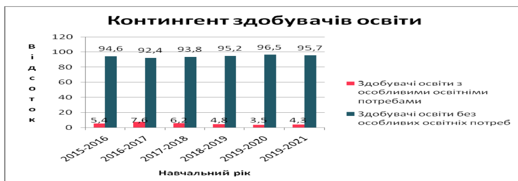
Рис. 1 Контингент здобувачів освіти ДНЗ «Одеський центр професійно-технічної освіти» (2015–2021 рр.).

Окрім того, ДНЗ «Одеський центр професійно-технічної освіти» надає професійну освіту дітям з особливими потребами (зокрема, з порушеннями слуху) як в інклюзивних, так і в спеціальних групах, та забезпечує соціальний захист таких учнів, їх професійну реабілітацію, зайнятість, адаптацію до суспільного життя (рис. 1).