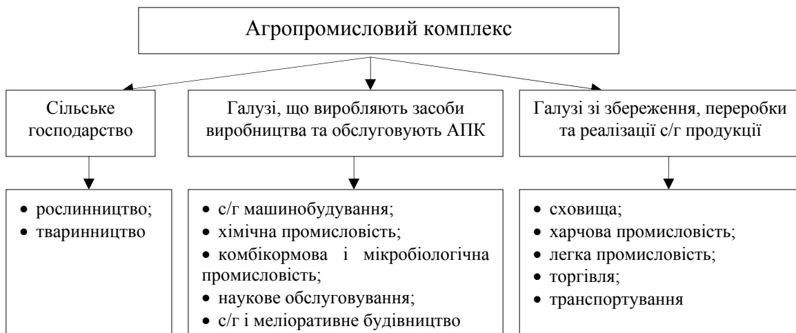
Рис. 1 Галузева структура агропромислового комплексу