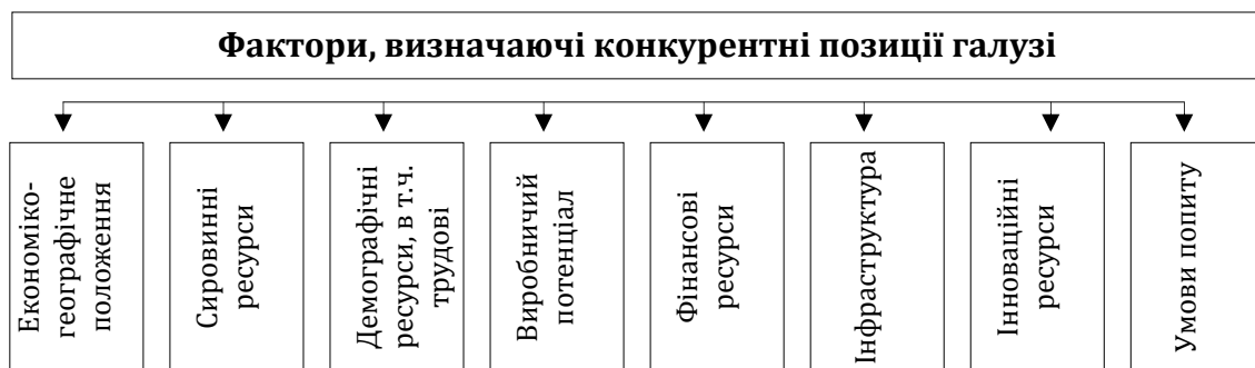
Рис. 3 Фактори, що визначають конкурентні позиції агропромислового комплексу

5. Фінансові ресурси. Однією з головних причин консервації кризових явищ у виробничій і фінансовій сферах являється брак обігових коштів. Скорочення вкладень у виробництво обумовлене зниженням державного фінансування інвестиційних програм і об'ємів коштів самих підприємств [10].