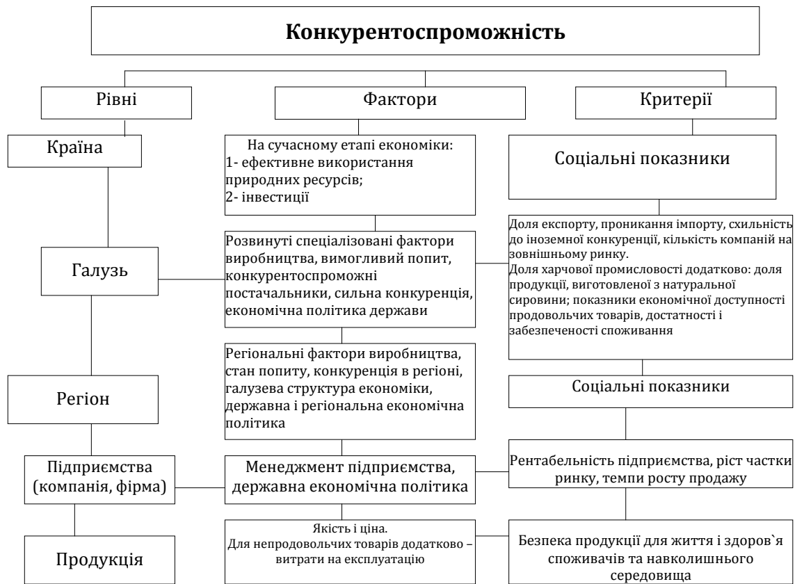
Рис. 4 Рівні, фактори і критерії конкурентоспроможності *Авторська розробка

Конкуреноспроможність країни, відповідно до поширеного визначення комісії США по промисловій конкурентоспроможності, трактується як «ступінь, з якою нація за вільних і справедливих умов ринку виробляє товари і послуги, що задовольняють вимогам світового ринку, формуючи і збільшуючи при цьому реальні доходи своїх громадян» [12]. В цьому визначенні виділяються три головні вимоги. По-перше, здатність країни виробляти продукцію і послуги, що відповідають міжнародним стандартам за якістю і конкурентоздатні за ціною. По-друге, наявність вільних і справедливих умов ринку, при яких держави не здійснюють протекціоністську політику по відношенню до національних компаній і не обмежують діяльність іноземних. Дотримання цієї вимоги на практиці викликає суперечки і є джерелом торгових протиріч між країнами. У зв'язку з цим в Щорічнику світової конкурентоспроможності (Лозанський інститут менеджменту і розвитку) і Доповіді по глобальній конкурентоспроможності