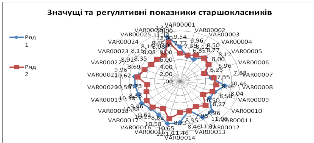
Рис. 2 Представленість життєвих домагань старшокласників на обох регулятивних рівнях

Примітка: позначення на рис. 2 (VAR00001..... VAR00026) відповідають шкалам методики