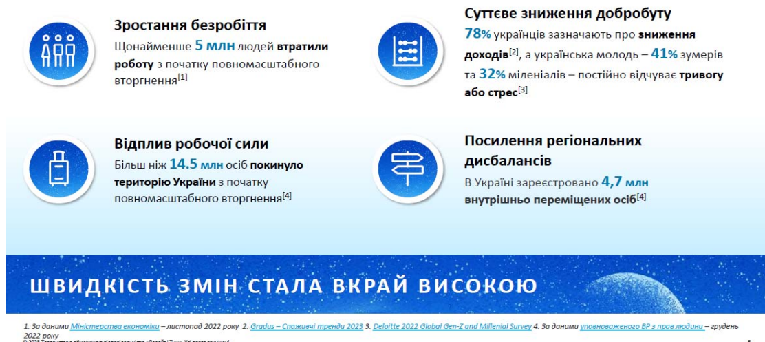
Рис. 1 Наявні виклики України

Повномасштабна війна в Україні посилила вже наявні виклики, а також створила нові