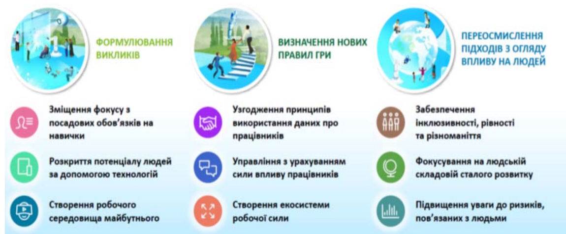
Рис. 2 Тренди у сфері людського капіталу 2023 [22]

Учасники форуму наголосили на необхідності пошуку особливих рішень на ринку праці і прогнозах на найближчі 6–10 років. Найголовніше це сфокусуватись на ключових професіях, які будуть затребувані найближчим часом: це підготовка інженерів та технічних спеціалістів для відновлення оборонно-промислового комплексу і розвитку вітчизняних військових технологій, військові фахівців усіх спеціальностей, медичні працівники, реабілітологи, фахівці STEM-освіти, психологи, соціальні працівники, IT і кібербезпека, енергетична галузь для впровадження проектів зеленого переходу, фахівці публічної політики та врядування, державного управління, а також будівельники, архітектори, проектанти для відбудови нашої держави.