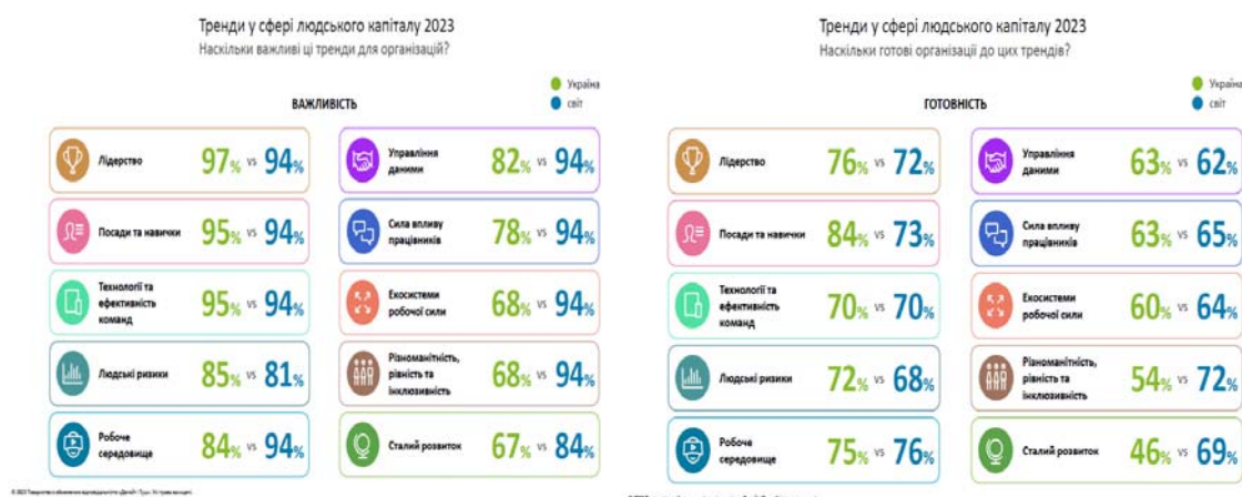
Рис. 3 Найважливіші фактори для успіху

Нині бізнес усвідомлює невідворотність змін і нових підходів. Еволюція ринку праці вимагає активізації лідерських здібностей та ефективності менеджменту, які більшість респондентів Deloitte назвали найважливішими факторами для успіху [22].