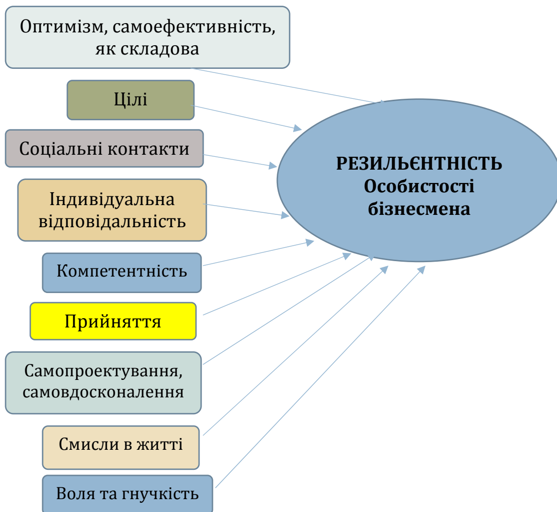
Рис. Модель резильєнтності особистості бізнесмена в період воєнного стану в Україні

Отже, модель резильєнтності особистості бізнесмена являє собою систему стійких позитивних рис, це ресурс особистості, який сприяє успішному поверненню людини до нормального психічного та фізичного стану після стресових і травматичних подій для можливості існування, успішної роботи та ведення господарської діяльності.