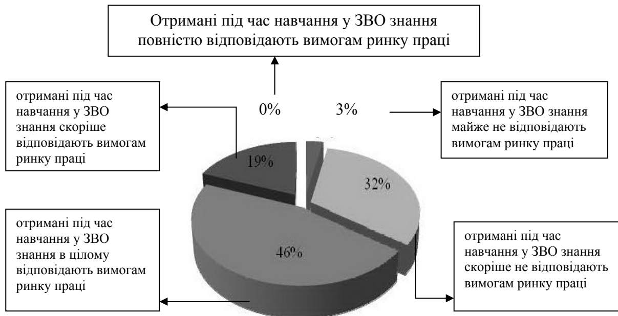
Рис. Рівень відповідності отриманих під час навчання в Інституті міжнародної та порівняльної освіти (Китай) знань, вмінь та навичок вимогам ринку праці

формуванню умов для уніфікації змісту, обсягів та механізмів надання університетами освітянської послуги.