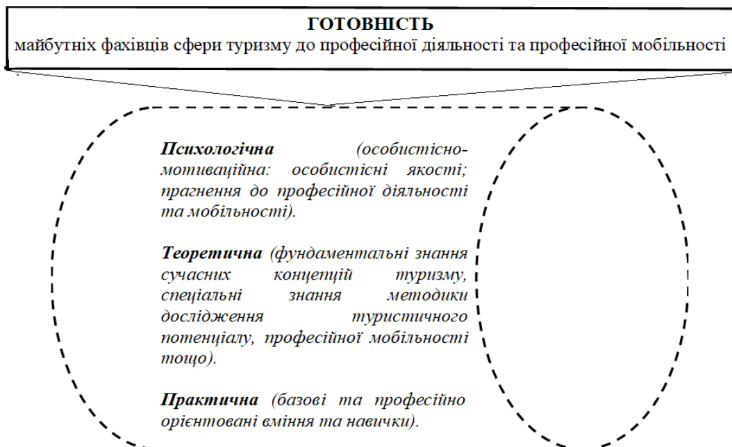
Рис. Структура готовності майбутніх фахівців сфери туризму до професійної діяльності та професійної мобільності

Сильний мотив суттєво впливає на мету діяльності, підкріплює її. Для того, щоби підвищити рівень професійної компетентності майбутніх фахівців сфери туризму, потрібна мотивація росту в професійній діяльності, бажання отримати нові знання та набути практичних навичок, стійкі пізнавальні інтереси. Активізації процесу формування професійної компетентності майбутніх фахівців сфери туризму сприяє наповнення змісту освітнього процесу. Наповнення мотиваційним компонентом середовища дає суттєві результати в процесі підготовки майбутніх фахівців сфери туризму, а саме стимулює творчу активність студентів.