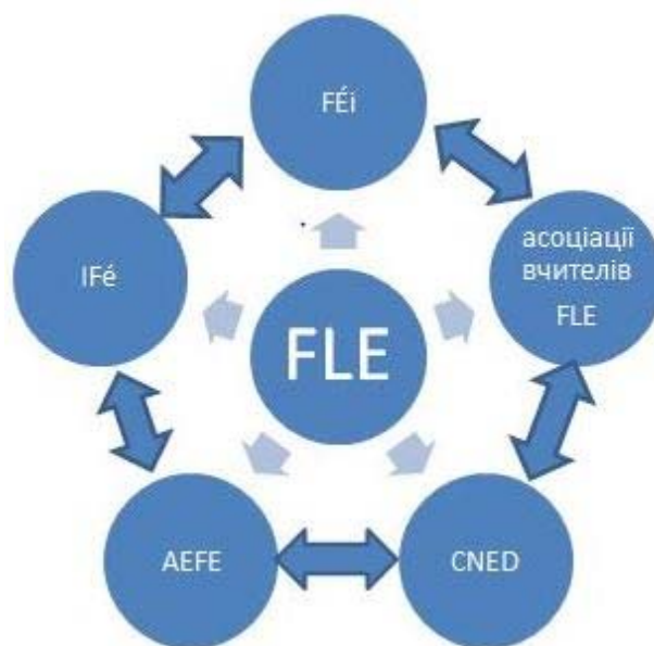
Рис. Установи з організації професійного розвитку вчителів FLE

Варто зазначити, що професійна підготовка вчителів французької мови як іноземної здійснюється магістратурою в 27 академіях (Екс-Марсель, Амьєн, Безансон, Бордо, Кан, Клермон-Ферран, Корсика, Кретей, Діжон, Гренобль, Гваделупа, Гайана, Лілль, Лімож, Ліон, Мартініка, Нансі-Мец, Нант, Ніцца, Орлеан-Тур, Париж, Пуатьє, Реймс, Ренн, Страсбург, Тулуза, Версаль) [4], проте курси підвищення кваліфікації вчителів французької мови як іноземної в регіональних академіях, поряд з іноземними мовами та мовами національних меншин, не проводяться. Натомість вдосконалення вчителів здійснюється у спеціалізованих державних навчальних закладах, створених для вивчення та популяризації французької мови і культури.