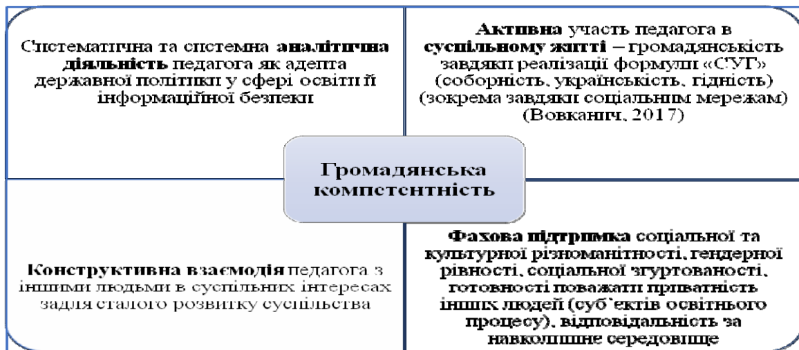
Рис. 1 Комплекс завдань для формування громадянської компетентності педагога Нової української школи

На основі завдань для формування громадянської компетентності педагога Нової української школи визначено складові формування громадянської компетентності такого фахівця (рис. 2).