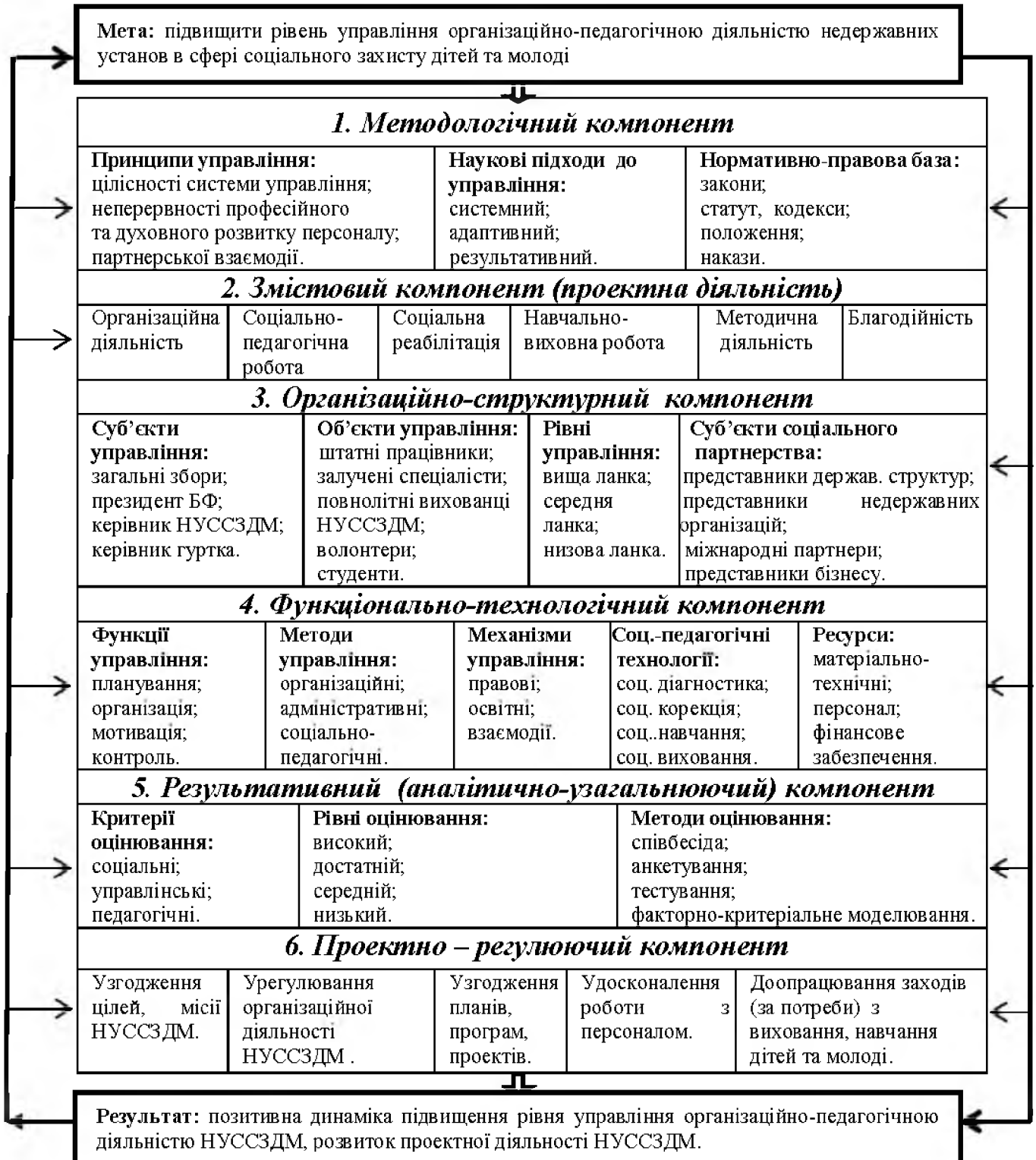
Рис. 1. Модель управління організаційно-педагогічною діяльністю недержавних установ у сфері соціального захисту дітей та молоді