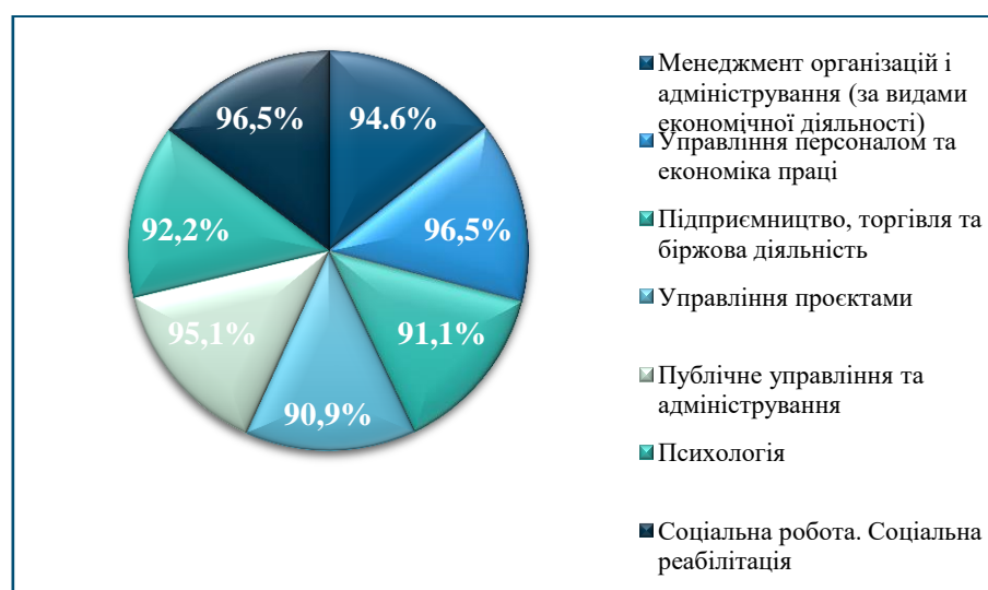
Рис. 2. Результати успішності здобувачів другого (магістерського) рівня вищої освіти денної форми навчання