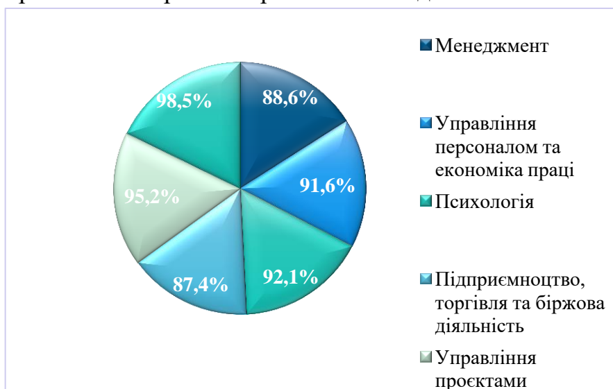
Рис. 1. Результати успішності здобувачів першого (бакалаврського) рівня вищої освіти денної форми навчання

Результати заліково-екзаменаційних сесій здобувачів другого (магістерського) рівня вищої освіти за денною формою навчання в 2024-2025 н. р. свідчать про належне оволодіння магістрантами ОПП/ОНП. Абсолютна успішність дорівнює 100 %, а якість – більше 90 %. Комплексні іспити показали, що абсолютна більшість здобувачів освіти випускних курсів засвоїли програмний матеріал, володіють необхідними теоретичними знаннями, набули відповідний практичний досвід, вміють застосовувати професійні знання при вирішенні конкретних практичних завдань.